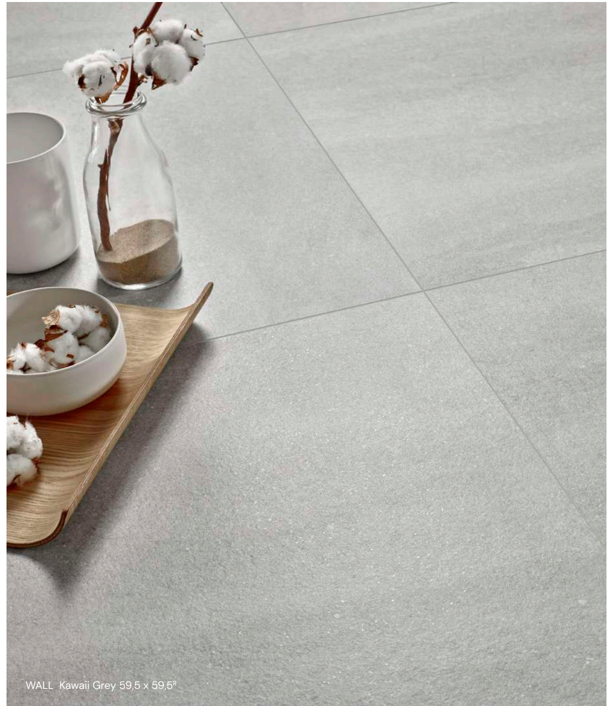
WALL Kawaii Grey 59,5 x 59,5 R

Rodapié 9,7 x 59,5 Moon 223179 P24 Grey 223178 P24