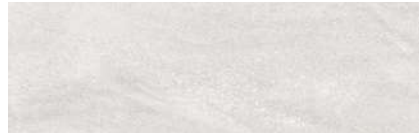
Kawaii Moon 31,6 x 100 R 222288 M75