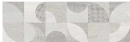
Yugen Mix 31,6 x 100 R 222295 M77