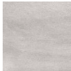
Kawaii Grey 59,5 x 59,5 R 223176 M70