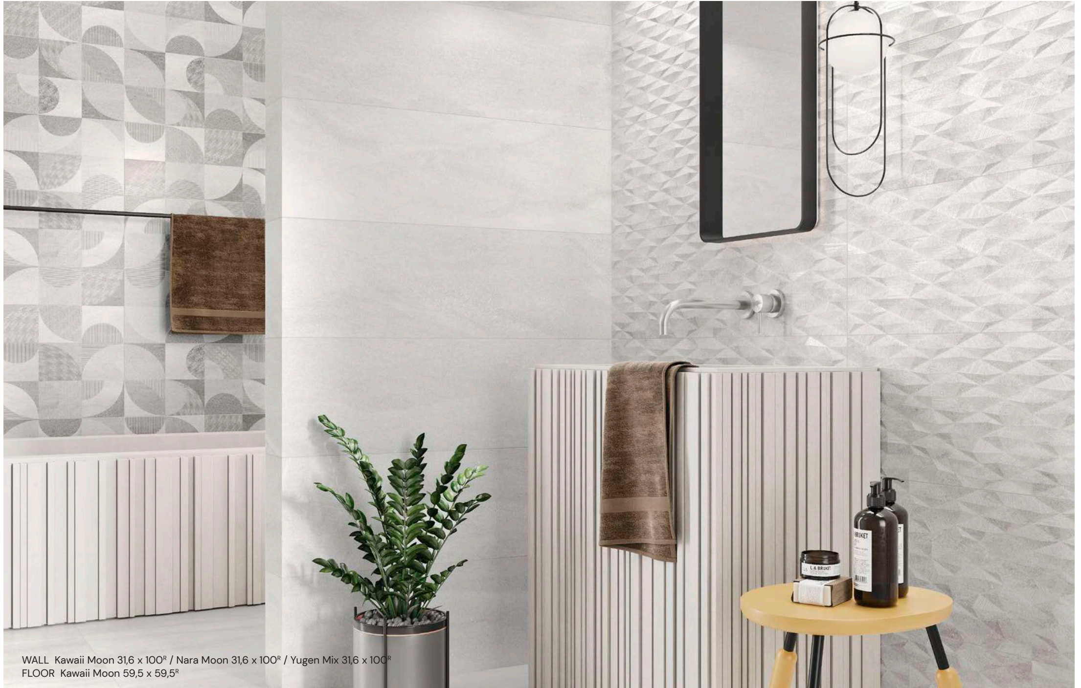
WALL Kawaii Moon 31,6 x 100 R / Nara Moon 31,6 x 100 R / Yugen Mix 31,6 x 100 R FLOOR Kawaii Moon 59,5 x 59,5 R