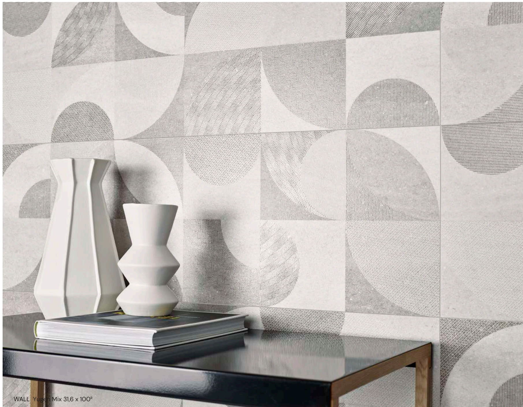
WALL Yugen Mix 31,6 x 100 R