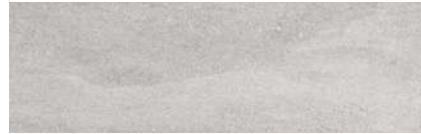
Kawaii Grey 31,6 x 100 R 222289 M75