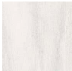
Kawaii Moon 59,5 x 59,5 R 223177 M70