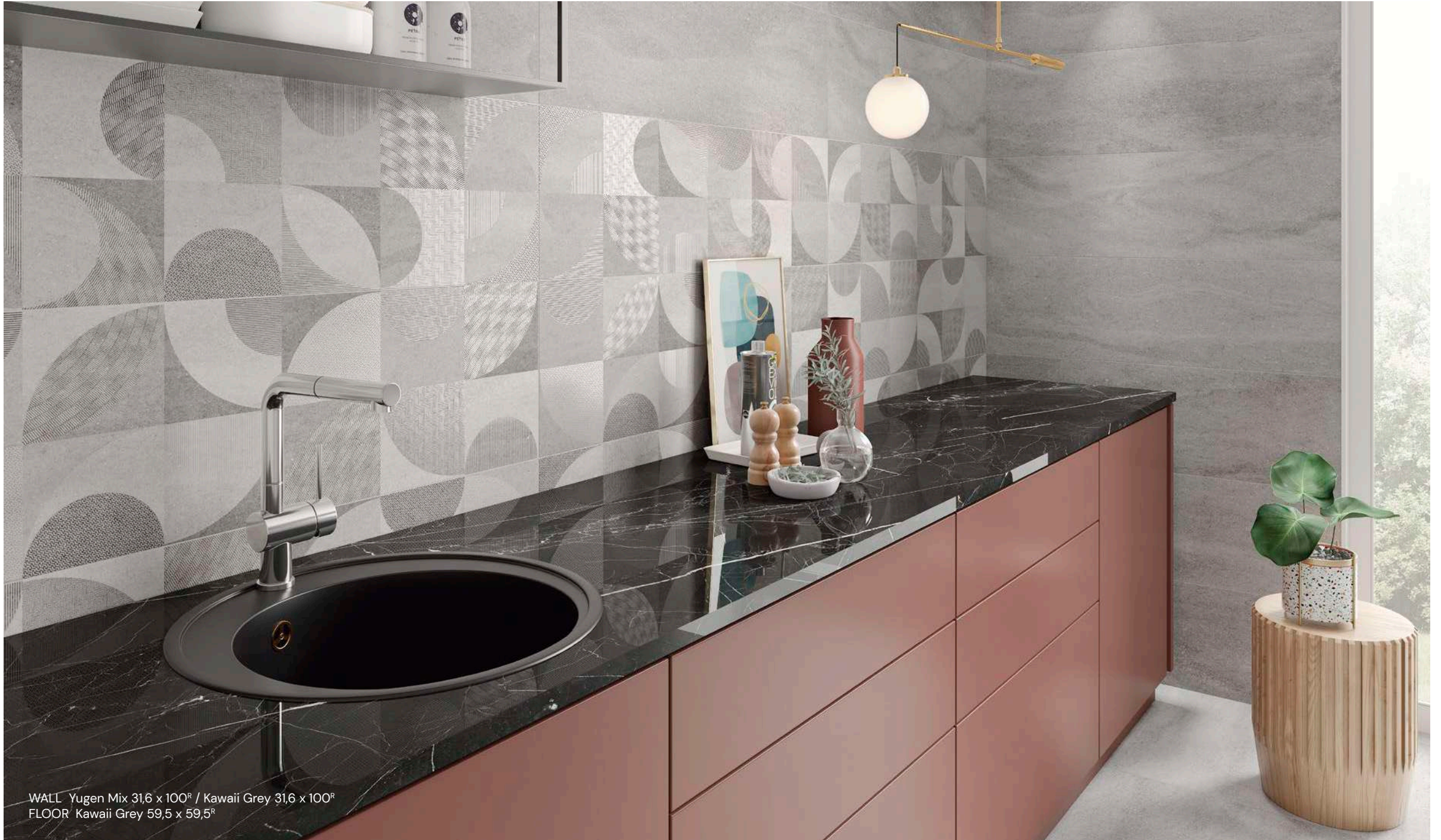
WALL Yugen Mix 31,6 x 100 R / Kawaii Grey 31,6 x 100 R FLOOR Kawaii Grey 59,5 x 59,5 R